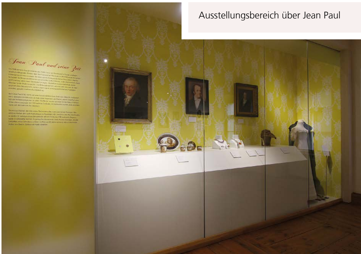
Ausstellungsbereich über Jean Paul

Einen unterhaltsamen und informativen Einblick in die Geschichte des Fichtelgebirges erhält der Besucher des Museums auf einem Rundgang durch die Ausstellungen. Das Leben und die Kultur der Menschen in der Region vom Mittelalter bis in die Gegenwart stehen dabei im Vordergrund. Auch der Innenhof dient als Ausstellungsfläche für Kunstwerke aus Marmor und Granit. Schmied und Töpfer führen in den lebendigen Werkstätten ihr Können vor. Das Museumscafé hat das ganze Jahr über geöffnet.