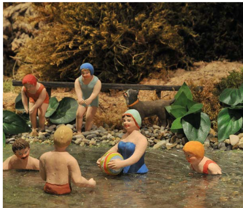
Detail am Badeteich