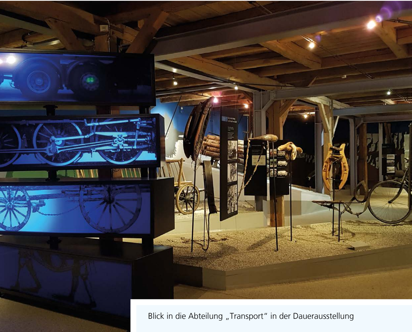
Blick in die Abteilung „Transport“ in der Dauerausstellung