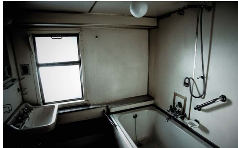
Blick in das Badezimmer

In den Jahren 1952 bis 1955 gaben die Alliierten die noch vorhandenen Salonwagen an die Deutsche Bundesbahn ab, so auch 1953 den 10 242. In der folgenden Zeit diente der Wagen der Regierung der BRD – vorrangig für Reisen verschiedener Bundeskanzler. So fuhr der Salonwagen 1957 als Wahlkampfzug Konrad Adenauers. Für ein ganz besonderes Ereignis im Jahr 1965, den Deutschlandbesuch von Queen Elizabeth II., wurde der Wagen extra rot lackiert. Die Königin von England nutzte den 10 242 als Nachrichtenwagen. Politisch von besonderer Bedeutung ist sein Einsatz beim DDR-Besuch Willi Brandts am 19. März 1970 in Erfurt. Am 29. Januar 1988 wurde der Salonwagen 10 242 ausgemustert. Auf einem Nebengleis in Münster verschlechterte sich sein Zustand zunehmend. Kurz vor