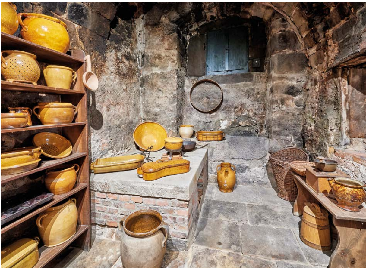
Die schwarze Küche stammt noch aus der Erbauungszeit der Lateinschule im 16. Jahrhundert. Hier wurde auf offenem Feuer gekocht.

Töpferscheibe zu Gefäßen gedreht und anschließend bei 1000 Grad in großen mit Holz befeuerten Öfen gebrannt. Bereits im 19. Jahrhundert war Thurnau bekannt für die gute Qualität der hier produzierten Töpferware. Bis nach Nürnberg, Erlangen, Bayreuth und Bamberg wurde das Geschirr verkauft. Mit Anschluss Thurnaus an die Eisenbahn wurden sogar Märkte in München, Leipzig und Augsburg angefahren. Neben Töpfen, Tiegeln und Kannen verkauften die Töpfer „Erbeshofn“, „Böhmisch Häffala“ oder „Hosnbrodnpfanna“.