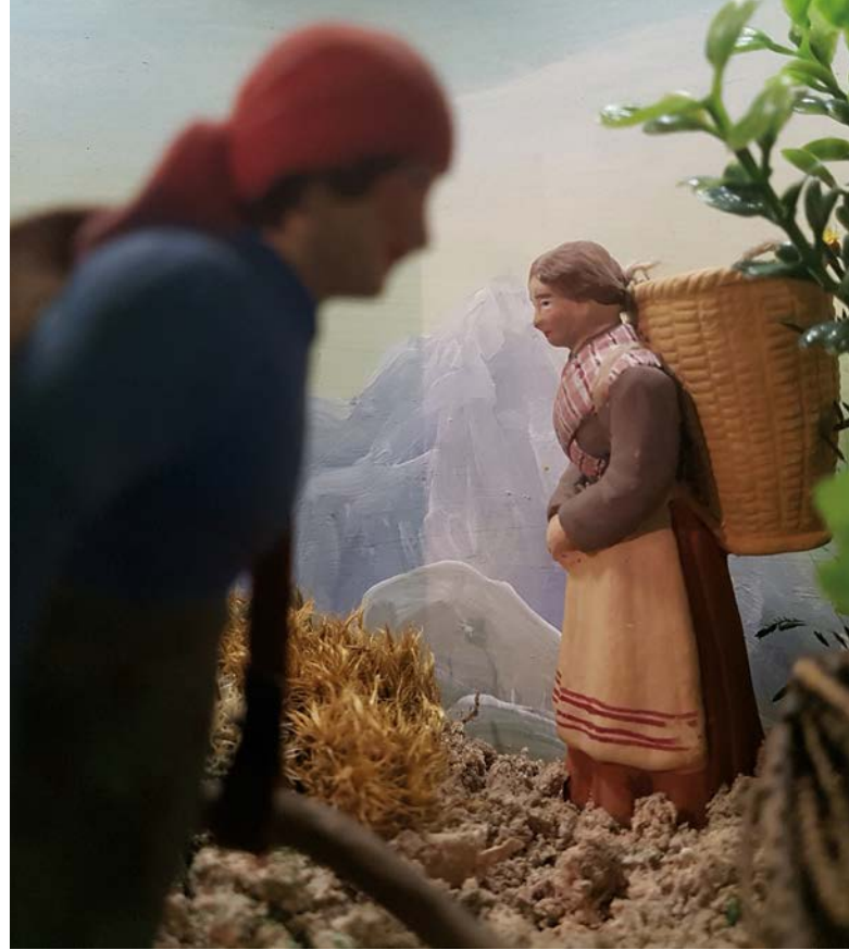
Frauen mit Kretze beim Holz sammeln

Einzigartig in der Region sind die Marktredwitzer Landschaftskrippen. Sie reihen amüsante und typische Szenen aus dem Landleben um die Jahrhundertwende aneinander und bilden eine idealisierte Welt im Miniaturformat ab. Nahezu nebensächlich wirkt im Vergleich dazu das Heilsgeschehen rund um die Geburt Christi. Dennoch war Sinn und Zweck dieser Krippen das Heilsgeschehen in die eigene Lebenswirklichkeit zu integrieren. Die Weiß'sche Krippe gehört zu den schönsten Krippen dieser Art. Sie wurde in der zweiten Hälfte des 19. Jahrhunderts von den Marktredwitzer Hafnerfamilien Meyer, Patz und Völkl geschaffen. Die Töpferfamilien hatten durch das Aufkommen und rasche Erstarken der Porzellanindustrie Absatzprobleme im Geschirrbereich. So kam es in Marktredwitz zur Produktion von tönernen Krippenfiguren. Besonders schön sind einzelne Szenen vom Landleben, wie der Jahrmarkt, das Bad im Dorfteich, der Kirchgang und vieles mehr. Mit über 2000 Figuren kann das Auge des Betrachters eine Reise in die Vergangenheit unternehmen und die Landbevölkerung und ihre Aktivitäten während des Jahreslaufes betrachten.