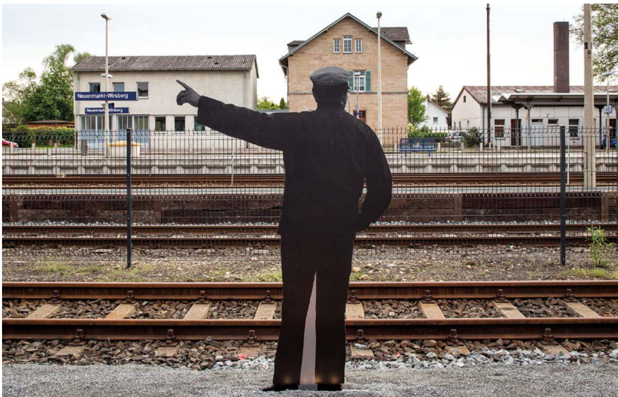
Mit der Bahn ins Museum – das DDM befindet sich direkt am Bahnhof Neuenmarkt.

Lebensgroße Figuren, zahlreiche interaktive Medienstationen und Inszenierungen vermitteln im Lokschuppen und im Freige-lände die Faszination und das Wissen rund um die „Dampfriesen“ und das Arbeiten im ehemaligen Bahnbetriebswerk auf eine moderne und anschauliche Art und Weise. Besondere Prunkstücke der Ausstellung im Museum sind der Salonwagen 10 242 aus dem Sonderzug der Bundesregierung, die Schnellzugdampflok 10 001 – ein Einzelstück – oder die große Modellbahnanlage in H0 – sie zeigt Europas erste Eisenbahnsteilstrecke im reinen Reibungsbetrieb, die „Schiefe Ebene“.