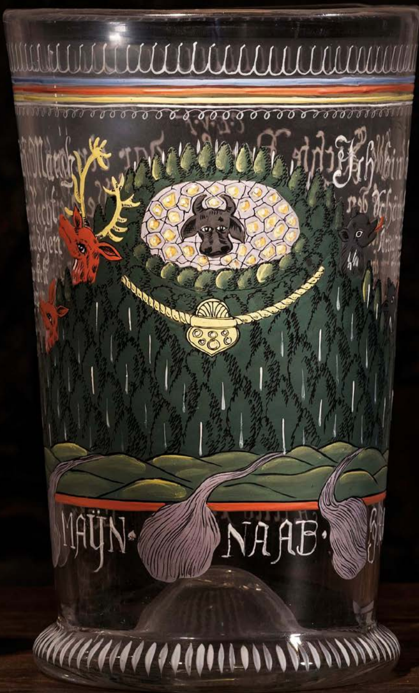
Ochsenkopfglas, Bischofsgrün 1688