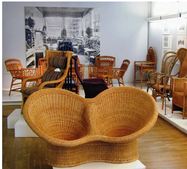
Der Möbelbau ist eine der vielen Spezialrichtungen der Korbmacherei. Im Vordergrund ist der Eiermann Zweisitzer zu sehen, der nach einem Entwurf des Berliner Architekten Egon Eiermann (1904 – 1970) gefertigt wurde.