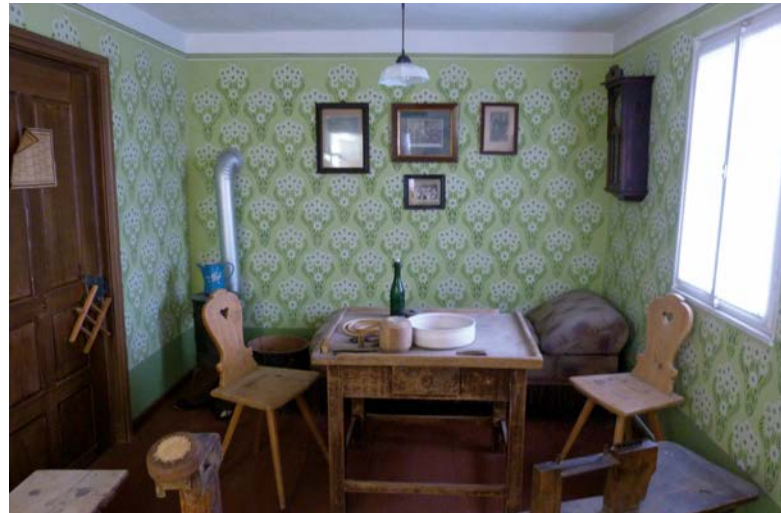
Die Korbmacherstube wurde aus Originalmöbeln von Korbmachern zusammengestellt.

Die ersten Körbe, Kataloge und Werkzeuge wurden in Michelau 1928 als Vorlagen zum Abzeichnen für eine Zeichenklasse der Korbfachschule gesammelt. Ab 1934 war diese Sammlung für die Öffentlichkeit zugänglich. Zwei Jahre später bekam das Museum seinen heutigen Namen. Zu den vielfältigen einheimischen Produkten kamen durch den Korbhandel Flechtobjekte aus der ganzen Welt nach Michelau. So entwickelte sich im Laufe der Zeit eine Sammlung mit vielen tausend Stücken.