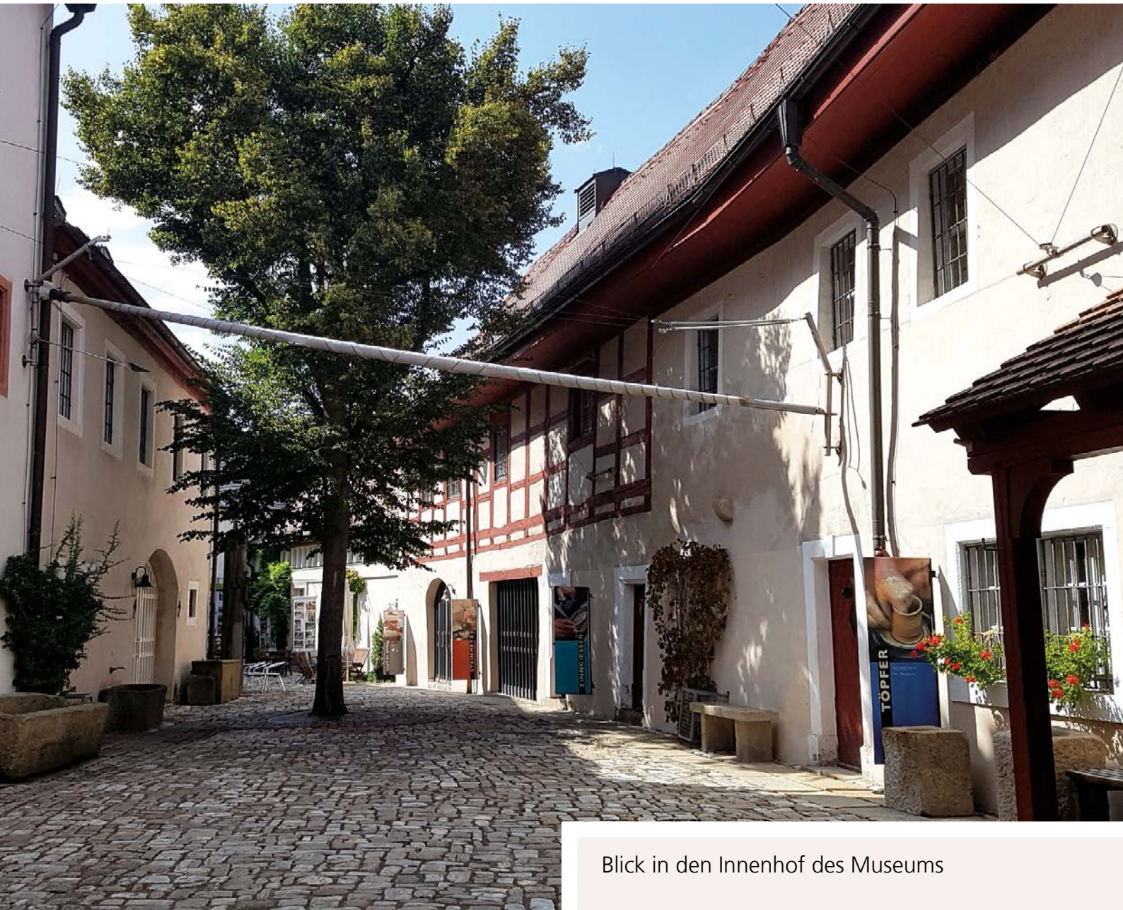
Blick in den Innenhof des Museums